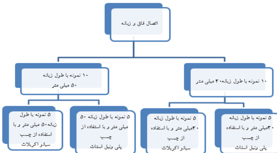
شکل ۲- الگوی شماتیک ساخت اتصال فاق و زبانه تحقیق

گروه دوم برای ایجاد اتصال فاق و زبانه با دو طول زبانه ۳۰ و ۵۰ میلی متر و با استفاده از دو چسب مختلف به شرح ذیل تقسیم بندی شدند.