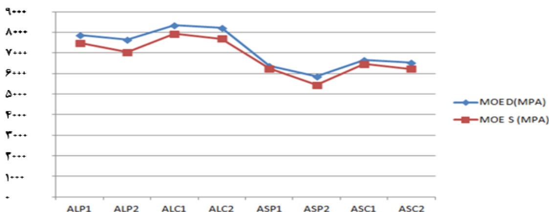
شکل ۵- مقایسه مدول الاستیسیته دینامیکی و استاتیکی تحقیق

کلید نمودار: A: گونه نراد / L: اتصال بزرگ / S: اتصال کوچک / P: چسب پلی وینیل استات / C: چسب سیانو اکریلات / ۱: اتصال دوبل / ۲: اتصال فاق و زبانه