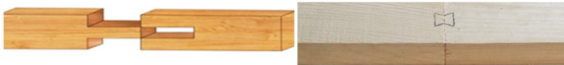
شکل ۳- تصاویر اتصال دم چلچله و اتصال فاق و زبانه