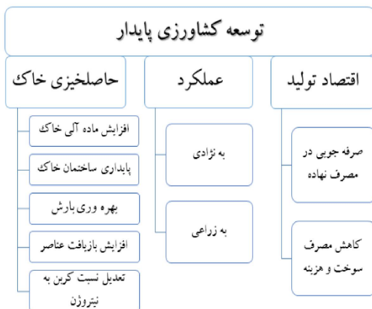
شکل ۲- اجزای اصلی در کشاورزی حفاظتی با استفاده از گیاهان علوفه‌ای در شرایط دیم توسعه کشاورزی پایدار

با کشت خالص غلات، بیشتر است. زمان برداشت این گیاهان در کشت مخلوط با غلات جهت تعلیف دام، موقعی است که اولین غلاف‌های آنها به خوبی توسعه یافته باشد و در این مرحله غلات در مرحله شیری و ابتدای خمیری شدن می‌باشند. ارزش غذایی تمامی گونه‌های ماشک در اوایل مرحله گل‌دهی با دیگر لگوم‌های علوفه‌ای یکسان است.