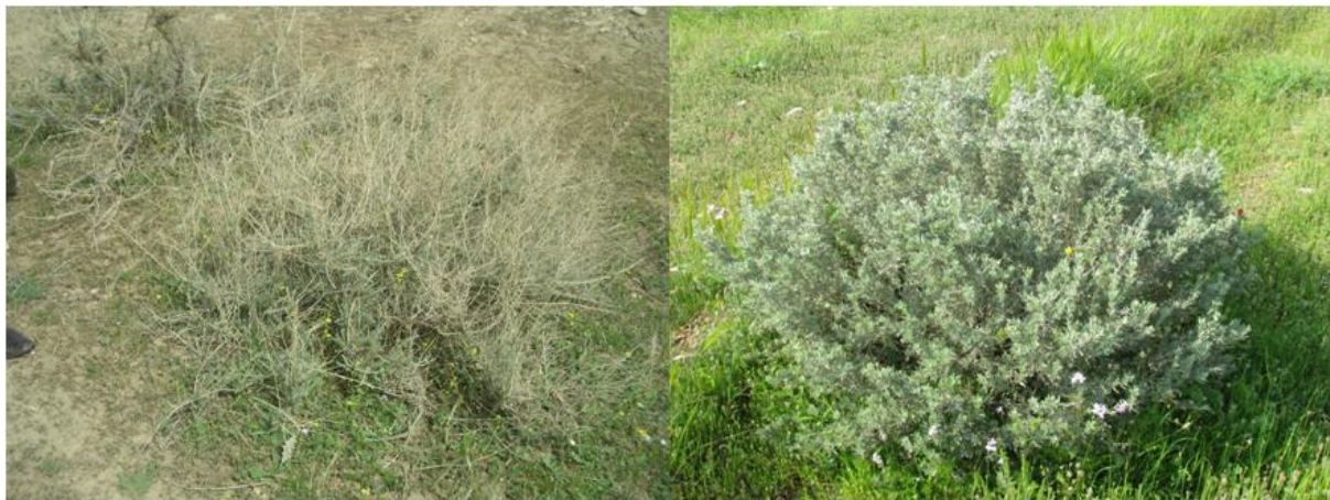
شکل ۲- استقرار گیاه آتریپلکس ( Atriplex cansens ) و علف شور ( Salsola Vermiculata ) در منطقه مورد مطالعه