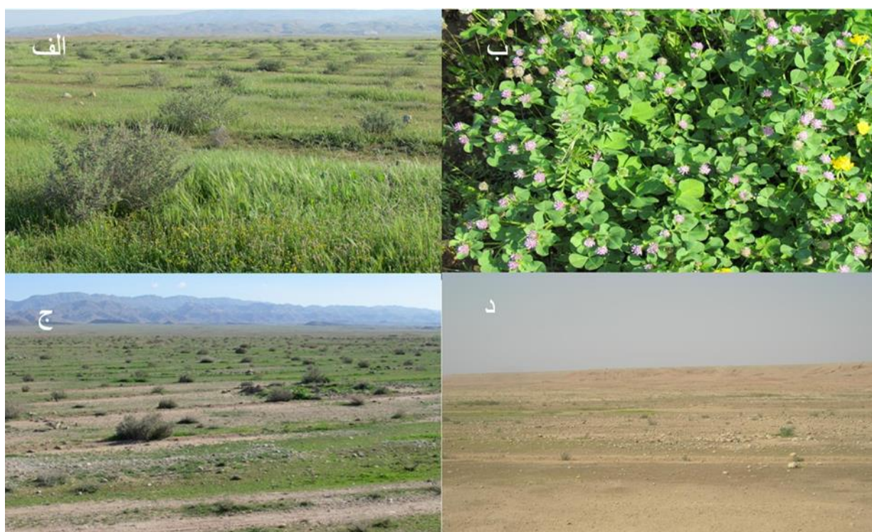
شکل ۳- پوشش گیاهی در تیمارهای مختلف: الف) تیمار پیتینگ همراه با بوته‌کاری، ب) تیمار پوشش گیاهی کف مرتع در تیمار پیتینگ، ج) تیمار سیستم چرای تناوبی- استراحتی، د) تیمار مرتع شاهد با بهره‌برداری متداول در منطقه (که دارای پوشش گیاهی فقیر و شرایط مناسب برای ایجاد کانون ریزگرد می‌باشد)

*: اعداد با حروف غیرهمسان اختلاف معنی‌داری در سطح ۵٪ با هم دارند.