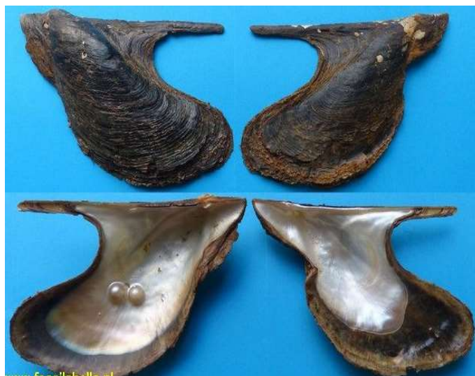
شکل ۴. نمای پشتی و شکمی دو کفه‌ای مروارید ساز زنی بال دار ( Pteria marmorata (Reeve, 1857)