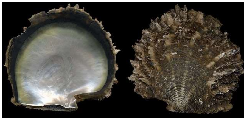
شکل ۲. نمای پشتی و شکمی دو کفه‌ای مروارید ساز محار کبیر ( Pinctada margaritifera (Linnaeus, 1758)

این دو کفه‌ای معروف‌ترین دو کفه‌ای مروارید ساز خلیج فارس بوده و مرغوب‌ترین مروارید نواحی گرمسیری را تولید می‌کند (مناسب‌ترین دو کفه‌ای جهت تولید مرواریدهای معروف به نیمه مروارید و مروارید Steel-black می‌باشد).