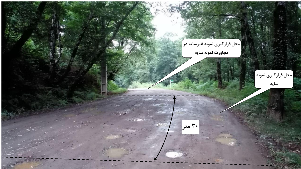
شکل ۱- نمایی از یک واحد نمونه سایه در منطقه مورد مطالعه

اندازه‌گیری همان بود که در استاندارد مطرح شده است. به این ترتیب که در ابتدا با استفاده از معیارهای مورد نظر در بخش بندی جاده‌ها، در طول جاده مورد بررسی و با در نظر گرفتن سه شدت ترافیکی، سه شاخه (بخش) به ترتیب در پایین‌بند، میان‌بند و بالابند انتخاب شد. سپس، هر شاخه به قطعه نمونه‌های ۳۰ متری تقسیم شد. با پیمایش جاده، واحدهایی که سایه‌اندازی درختان روی آن‌ها بیشتر از ۵۰ درصد (که به طور معمول طبق تجربه به صورت چشمی قابل تأیید است) بود، یعنی تصویر سایه درختان روی سطح جاده بیشتر از ۵۰ درصد سطح جاده را پوشانده بود، انتخاب شد.