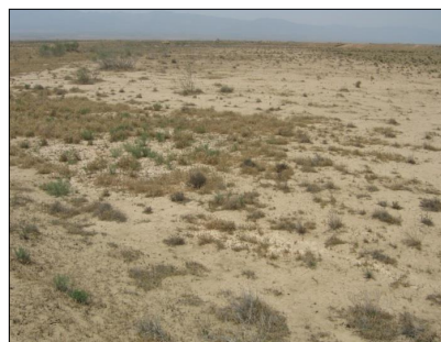
شکل ۳- وضعیت رسوب‌گذاری در پشته‌های آب‌گیر بخش سیلاب.