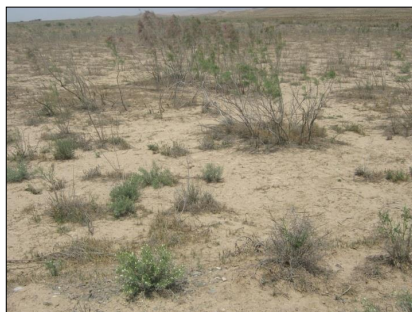
شکل ۲- وضعیت پوشش گیاهی در عرصه‌ی بخش پس از اجرای طرح بخش سیلاب.