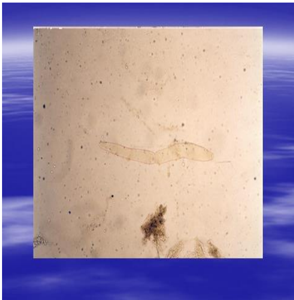
شکل ۲: مرحله تروفوزوئیت انگل گرگارین جداشده از میگوی سفید هندی (۱۰۰ برابر).