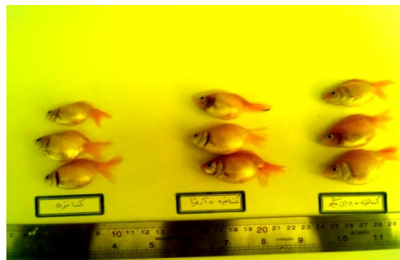
شکل ۱: ظاهر ماهیان آزمایش شده در تیمارهای مختلف از نظر میزان رشد در پایان دوره آزمایش

*حروف غیریکسان در یک بازه آزمون نشان دهنده اختلاف معنی دار تیمارها می باشد (P<۰/۰۵)