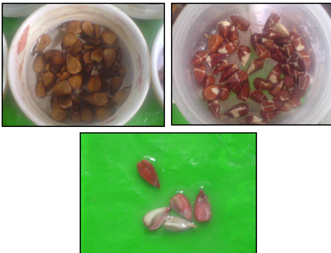
شکل ۱- بالا سمت چپ: بذره‌های خیس‌انده شده در آب برای کندن پوسته اول؛ بالا سمت راست: بذره‌های خیس‌انده برای کندن پوسته دوم؛ پایین: بذر سالم (۴ عدد) و ناسالم (۱ عدد) آغشته به محلول تترازولیوم ۱٪