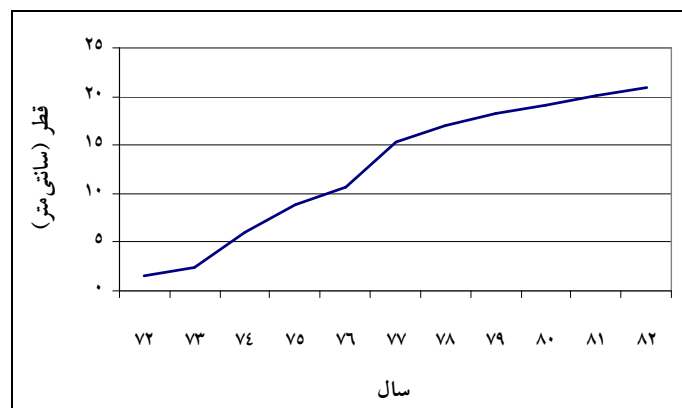
شکل ۱- منحنی رویش قطری کلن P.d. 63/51 طی سالهای ۱۳۷۲ تا ۱۳۸۲

پس از انتخاب ۲۰ کلن از میان ارقام بررسی شده در مراحل اولیه آزمایش (خزانه های سلکسیون) و تولید نهال به تعداد کافی، نهالها در فواصل 5 \times 5 متر در اراضی ایستگاه تحقیقات صنوبر صفرابسته کاشته شدند. کاشت کلن ها در اسفندماه ۱۳۷۲ انجام شد. قالب طرح آماری این تحقیق، بلوک های کامل تصادفی با سه تکرار می باشد. در این مطالعه تعداد نهال مورد استفاده از هر کلن ۷۵ اصله نهال یکساله (ساقه یک ساله و ریشه یک ساله) بوده، به طوری که از هر کلن در هر تکرار تعداد ۲۵ اصله نهال به صورت گروهی 5 \times 5 مورد کاشت قرار گرفتند که آماربرداریهای مورد نیاز فقط از ۹ اصله نهال میانی انجام شد و بقیه درختان به عنوان حاشیه در نظر گرفته شدند. در طول هر فصل رویش مقاومت و حساسیت کلن های مختلف به آفات و امراض نیز بررسی و مطالعه گردید. همه ساله در پایان فصل رویش، قطر درختان در محل ارتفاع برابرسینه ( 1/30 متر از سطح زمین) با کولیس و نوار قطر سنج تا دقت میلی متر و ارتفاع درختان با دستگاه