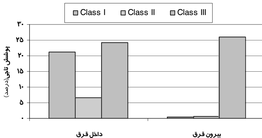
شکل ۲- میانگین دو سال ۸۳-۱۳۸۲ پوشش تاجی گونه‌های چندساله کلاسه‌های I، II و III در قرق کوهرنک

روند تغییرات میزان تولید گونه‌های گیاهی نیز تا حدودی از روند تغییرات پوشش تاجی گونه‌ها تبعیت داشت. گونه‌های چندساله با تولید قابل توجه و نیز مجموع تولید یکساله‌های پهن‌برگ علفی و گندمی در شکل ۳ نشان داده شده‌است. در مجموع، بوته‌ای‌ها تولید اصلی را به خصوص در خارج قرق به خود اختصاص دادند و یکساله‌ها در تولید نقشی نداشتند. گندمیان چندساله و بوته‌ای‌ها نقش ناچیزی در آن داشتند. نزدیک به ۹۹ درصد تولید خارج قرق از بوته‌ها تشکیل شده و گونه Astragalus adscendens نقش عمده‌ای را در آن بازی نمود. تولید گونه Daphne mucronata حدود ۱۵ درصد بود. در داخل قرق ۶۱ درصد تولید مربوط به بوته‌ای‌ها و نزدیک به ۳۰ درصد آن به پهن‌برگان علفی و حدود ۹ درصد به گندمیان چندساله تعلق دارد. گونه Elymus hispidus var. hispidus ، تقریباً همه تولید گندمیان را تشکیل می‌داد؛ در حالی که تولید در پهن‌برگان علفی به‌طور عمده و به‌ترتیب به چهار گونه Klucia Delphinium cyphoplectrum odoratissima و Tragopogon bupthalmoides و Galium sp. تعلق داشت و حدود ۲۵ درصد تولید کل را تشکیل می‌دادند؛ در صورتی که بقیه را باقیمانده گونه‌ها تولید نمودند.