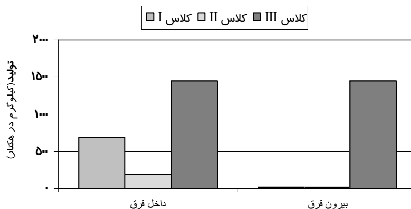
شکل ۴- میانگین تولید دو سال ۸۳-۱۳۸۲ گونه‌های چندساله کلاس‌های I, II و III در قرق کوهرنگ

تولید گونه‌های چندساله کلاس‌های II, I و III, در بیرون و داخل قرق کهیان در شکل ۴ نمایش داده شده است. در متوسط دو سال، تولید گونه‌های چندساله در داخل قرق ۱۸۴۴ کیلوگرم در هکتار، و در بیرون آن ۱۵۶۳