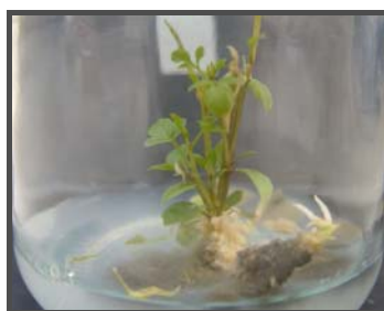
شکل ۱- رشد مطلوب گیاهچه‌های تولید شده در محیط کشت دارای آلودگی قارچی

= معنی‌دار بودن در سطح ۰/۰۱، NS = غیر معنی‌دار