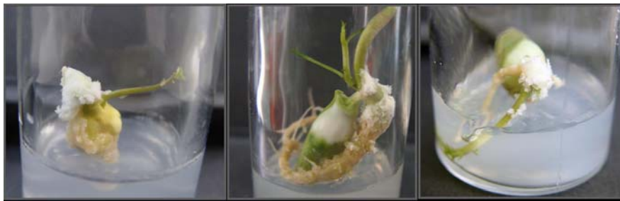
شکل ۳- تشکیل کالوس بر روی سطح بذرها