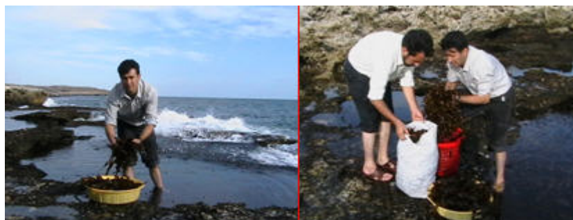
شکل ۱- نحوه جمع‌آوری استوک از دریا

یافته و جلبکهای سارگاسوم، سیستوسیرا و هیپنئا با توجه به میزان رویش آنها در این مناطق توسط کاردک فلزی استیل جمع‌آوری و داخل سبدهای پلاستیکی گذاشته و برای جلوگیری از تابش شدید نور آفتاب و خشک شدن جلبکها، گونی کفنی بر روی آنها قرار داده شد تا در کمترین زمان به سایت پرورش منتقل گردند (شکل ۱).