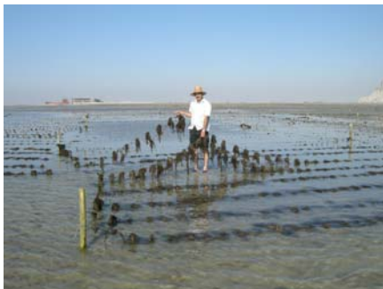
شکل ۳- روش کاشت جلبکها

دیگر ۱۰ متر و فاصله بین ردیفهای طناب نیز ۱ متر در نظر گرفته شد، این ابعاد براساس تحقیقات آبکناری (۱۳۸۳) و سایر محققان (De castro & Guanzon, 1993؛ Rago & Nyan, 1994؛ Godardo & Juanich, 1988؛ Thomes, 1991) تنظیم شده بود و پس از طراحی طنابهای آماده که نشاءها بر روی آنها کاشته شده بودند به عرصه آورده شده و به چوبها متصل شدند.