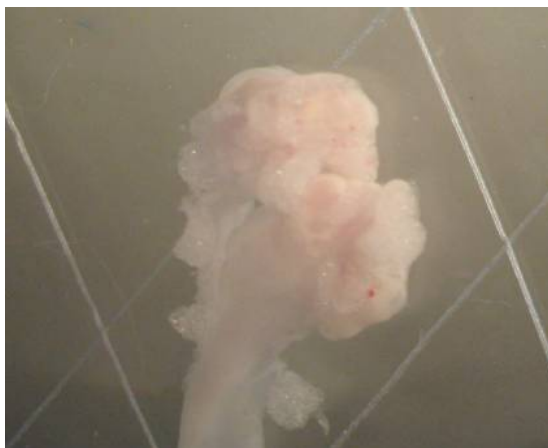
شکل ۱- نمای تخمدان و فولیکول‌های موش‌های صحرائی نابالغ گروه شاهد (بر روی تخمدان فولیکول بالغ و رسیده مشاهده نمی‌شود).