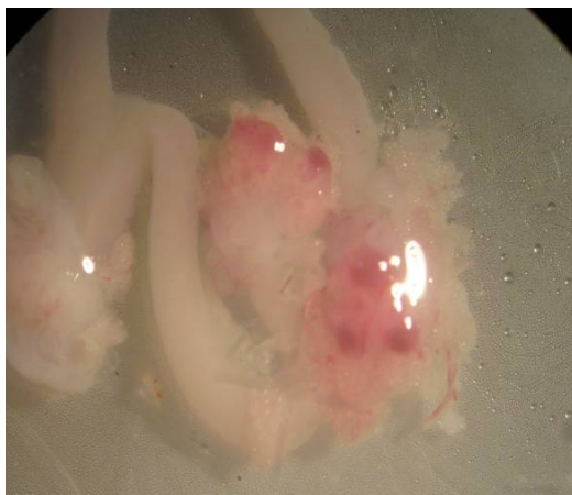
شکل ۲- نمای تخمدان و فولیکول‌های موش‌های صحرائی گروه کنترل مثبت اول (فولیکول‌های رسیده و پرخون بر روی تخمدان مشاهده می‌شود).