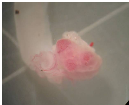
شکل ۳- نمای تخمدان و فولیکول‌های موش‌های صحرائی گروه کنترل مثبت سوم (فولیکول رسیده و پرخون بر روی تخمدان مشاهده می‌شود).