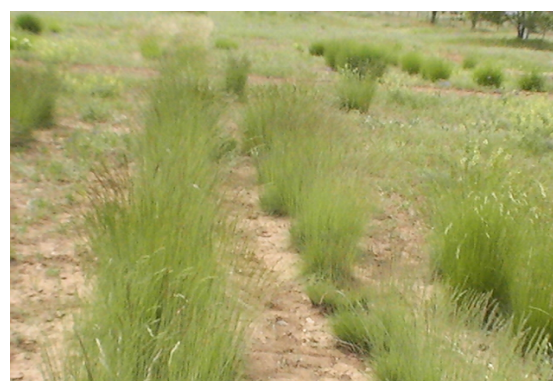
شکل ۱- گونه Elytrigia libanoticus L. در خزانه

ارزیابی از سال ۱۳۸۲ شروع گردید. شادابی گیاه همراه با برآورد تولید بذر و علوفه و سایر فاکتورهای رشد زنده‌مانی اکسشن‌ها نیز اندازه‌گیری شد. برای تعیین شادابی و در نهایت برای بنیه و زنده‌مانی به روش کیفی (درجه ضعیف، متوسط، خوب و عالی) ارزیابی شدند. در نهایت پس از تبدیل شدن ارزیابی کیفی به عدد، محاسبات آماری انجام شد.