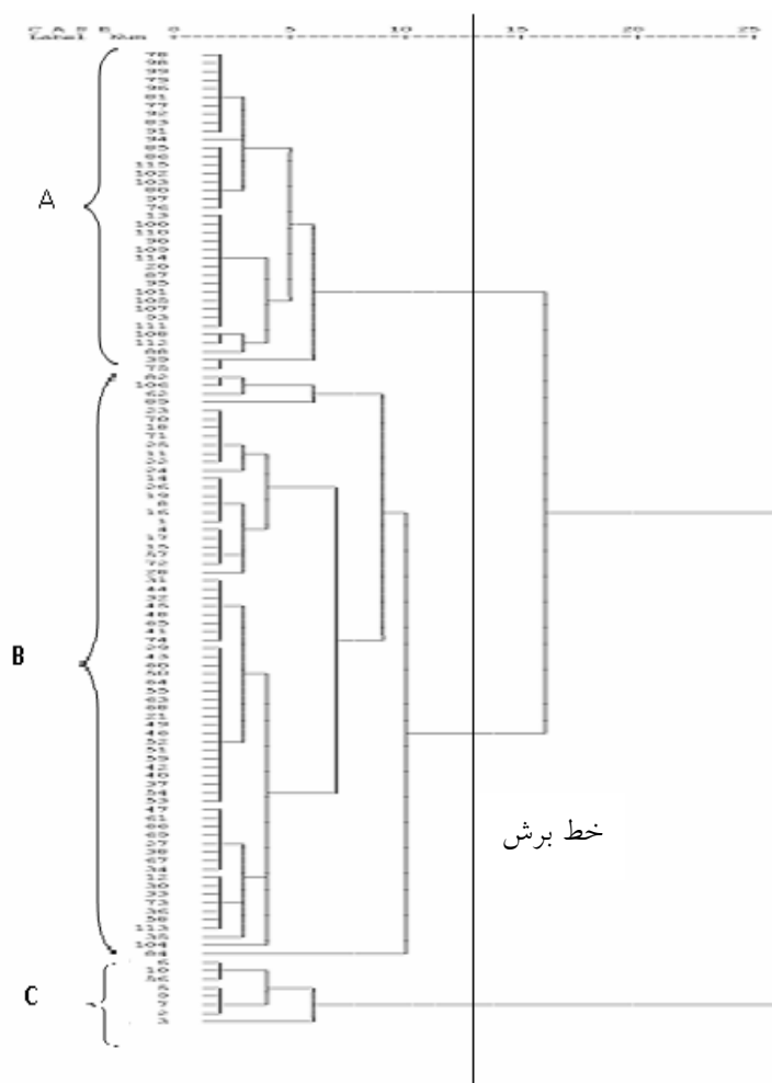
شکل ۲- تجزیه خوشه‌ای صفات کمی

توانایی ژن‌هایی که باعث وفق‌پذیری به یک محیط می‌شوند، در ایجاد سازش به چند محیط.