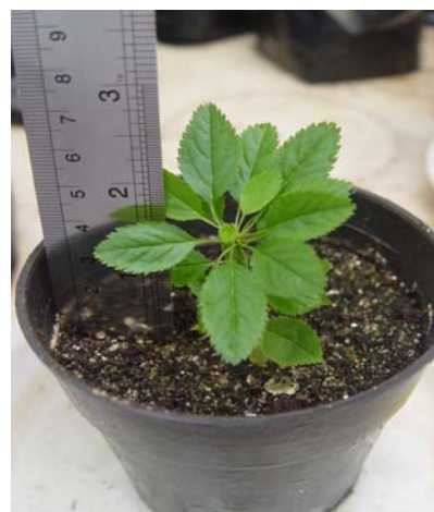
شکل ۶- مرحله سازگاری در گلخانه