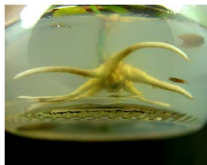
شکل ۳- ریشه‌زایی گیاه در درون شیشه

مرحله سازگاری با استفاده از مجموعه خاک پرلایت، پیت و ورمیکولایت صورت گرفت که میزان موفقیت آن در مورد گیاهان ریشه‌دار شده تحت تأثیر تیمار هورمونی IBA ۰/۵ میلی‌گرم در لیتر ۹۹٪ و در مورد تیمار هورمونی NAA ۰/۵ میلی‌گرم در لیتر ۷۰٪ است (شکل ۴). لازم به ذکر است که این گونه کند رشد، در فضای آزاد رشد بیشتری نسبت به شرایط کنترل شده گلخانه از خود نشان داد (شکل‌های ۵، ۶ و ۷).