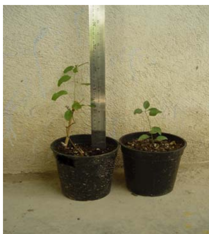
شکل ۷- مقایسه رشد طولی در شرایط گلخانه و محیط