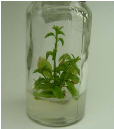
شکل ۲- ازدیاد شاخه در محیط بهینه شاخه‌زایی