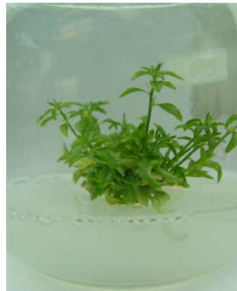
شکل ۱- مرحله استقرار ریزنمونه

ریشه‌دار شده رابطه آماری معنی‌داری مشاهده شد. به‌نحوی که بیشترین تعداد ریزنمونه‌های ریشه‌دار شده در تیمار ریشه‌زایی NAA ۰/۵ میلی‌گرم در لیتر دیده شد (شکل ۳ و جدول ۶).