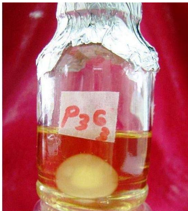
شکل ۱- رشد توده میسلیمی در کشت غوطه‌ور قارچ گانودرما