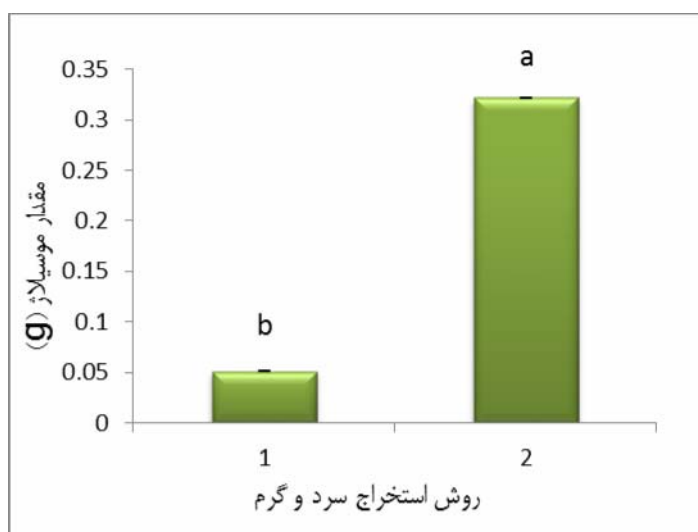
شکل ۱- تأثیر روش استخراج، بر مقدار موسیلاژ گیاه دارویی عناب (اکوتیپ مارون)

** در سطح احتمال ۱٪ اختلاف معنی‌دار است.