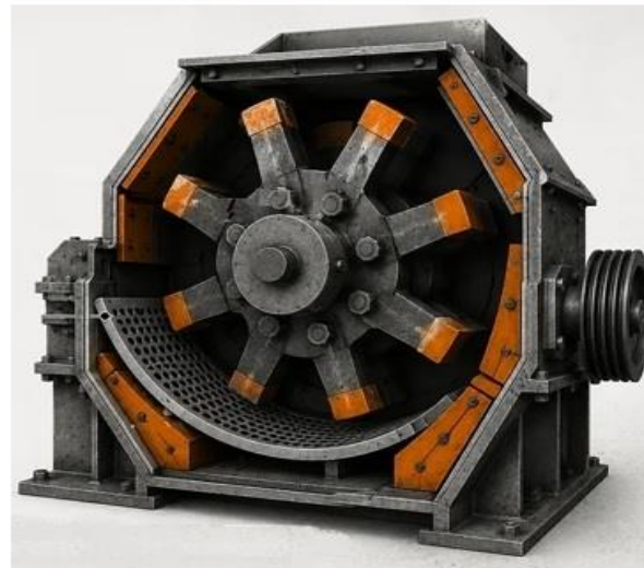
شکل ۴. نمایی از قرارگیری چکش‌ها در آسیاب (نقطه حساس سایش)