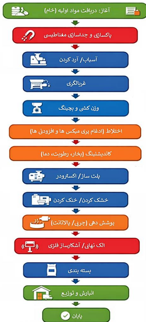
شکل ۱. فلوجارت کلی تولید خوراک خشک آبزیان (برگرفته از Hasting & Higgs, 1980)

است: کیفیت مواد اولیه، طراحی و نگهداشت خط تولید و کارآمدی نظام‌های کنترلی. این آلودگی به دلیل زیست‌تجمعی فلزات در اندام‌های آبزیان و انتقال به زنجیره انسانی، پیامدهای بهداشتی جدی به دنبال دارد. در پاسخ به این چالش، چارچوب فرایندمحور مبتنی بر اصول HACCP (FDA, 1997) شامل سه سطح اقدام ارائه می‌شود: