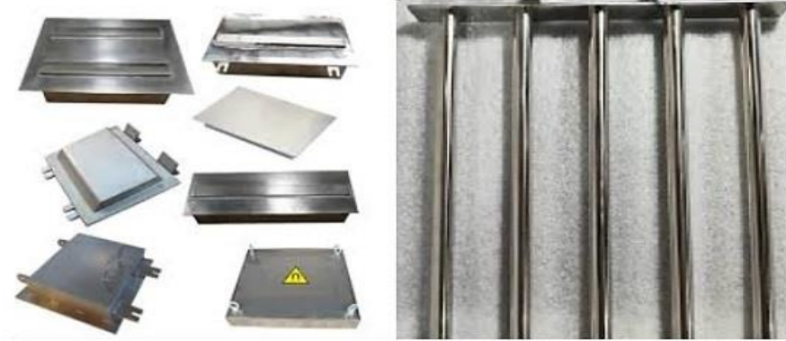
شکل ۲. نمونه‌هایی از مگنت نئودیمیومی مورد استفاده در خط تولید