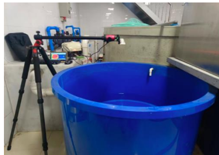
تصویر ۲- سامانه تصویربرداری طراحی شده برای مطالعه Hu و همکاران (۲۰۲۴) (مقاله با دسترسی آزاد)

تصمیم تصادفی (Random Forest) و ماشین بردار پشتیبان (Support Vector Machine- SVM) و نهایتاً یک پرسپترون چندلایه (Multi Layer Perceptron- MLP) می شوند تا وزن ماهی خاویاری بدون نیاز به تماس فیزیکی تخمین زده شود. نتایج آزمایش ها نشان داد که مدل بهبود یافته YOLOv5s توانسته دقت تفکیک بالا (Average Precision) - حدود ۸۹/۸ درصد - را حتی در شرایط انسداد (وقتی ماهی ها تا حدی روی هم قرار گرفته اند) به دست بیاورد؛ همچنین، همبستگی میان وزن واقعی و وزن تخمین زده غیرتماسی نیز به ۸۹/۸ درصد رسید.