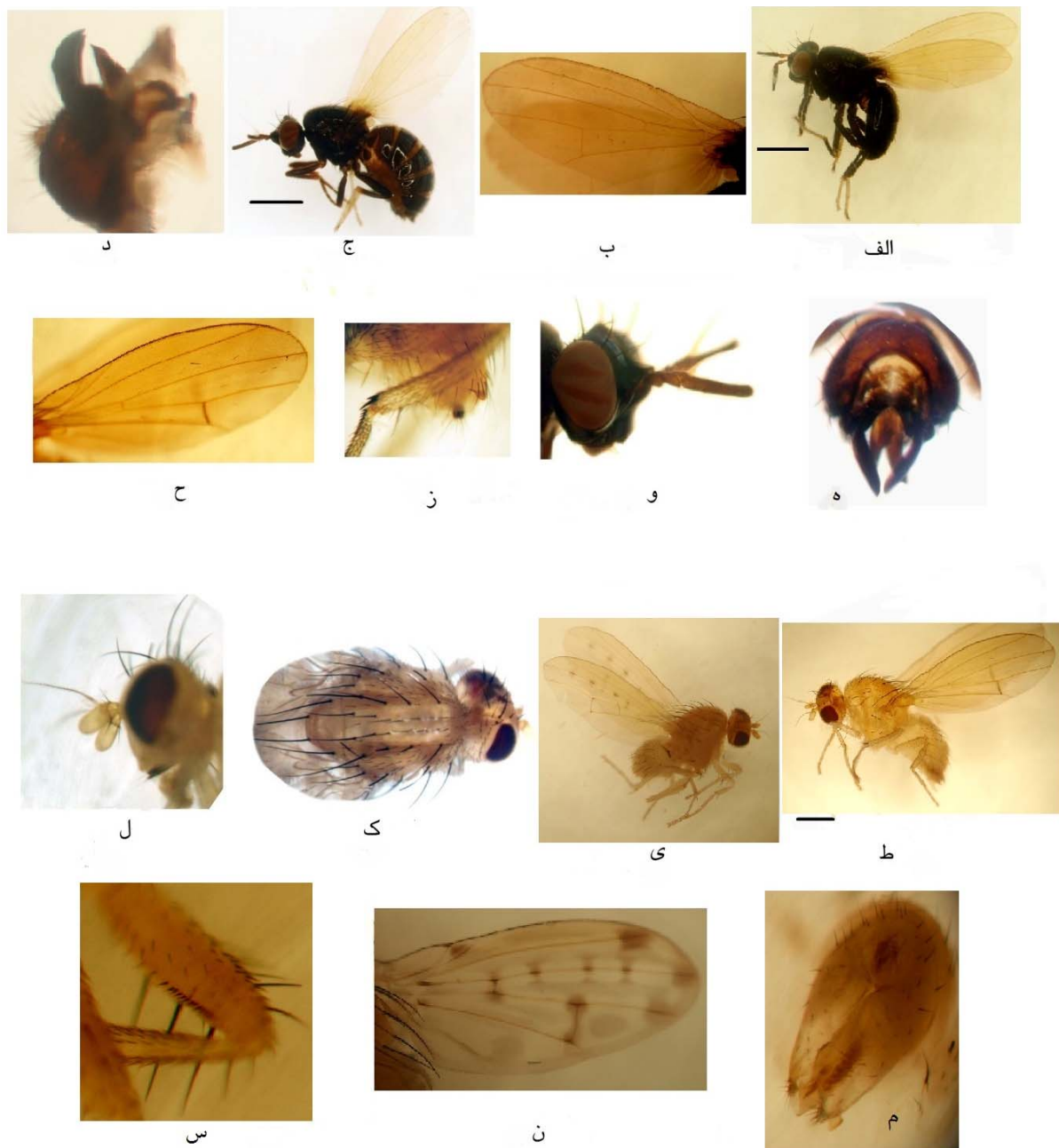
شکل ۱- Lauxania (Callixania) minor Martinek (الف- و) الف: حشره نر از سطح جانبی، ب: بال سمت راست، ج: حشره ماده از نمای جانبی، د: ژنیتالای حشره نر از سطح جانبی، ه: ژنیتالای حشره نر از سطح پشتی، و: سر از نمای جانبی؛ Tricholauxania claripennis E. Remm (ز-ک) ز: پای عقبی حشره ماده، ح: بال حشره ماده، ط: حشره ماده از نمای جانبی، ی: سر از نمای جانبی، ک: قفسه سینه از نمای پشتی؛ Eusapromyza martineki Shatalkin (ل-س) ل: حشره نر از نمای جانبی، م: پای جلو حشره نر، ن: بال حشره نر، س: ژنیتالای حشره نر از نمای پشتی (اصلی).