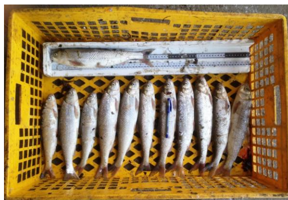
شکل ۱: تصویر ماهی سفید دریای خزر در این مطالعه طی سال‌های ۱۳۹۹-۱۴۰۰

EF: فرکانس قرار گرفتن در معرض (۳۵۰ روز در سال)؛ EDtot: مدت زمان قرار گرفتن در معرض (۳۰ سال)؛ FIR: