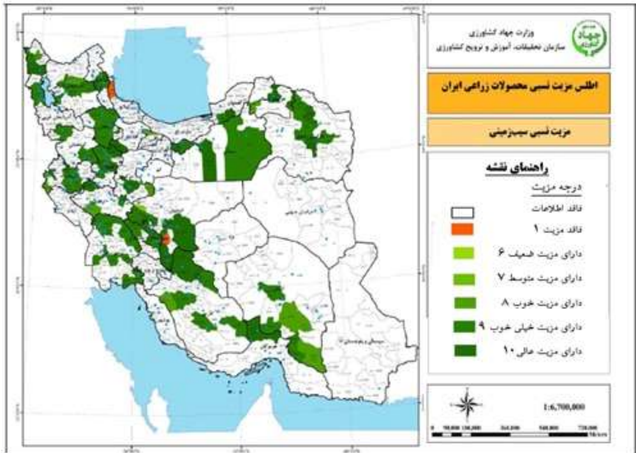
شکل ۱- مزیت نسبی تولید سیب زمینی در نقاط مختلف کشور