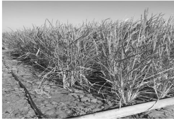
شکل ۱- مزرعه برنج در زمان رسیدن کامل محصول.