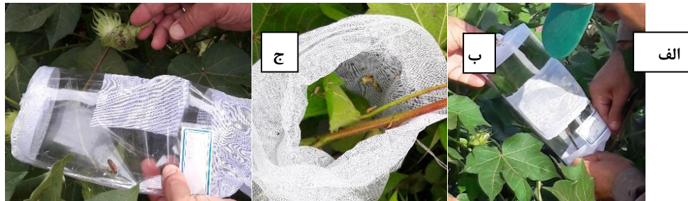
شکل ۳- الف) نمونه قفس‌های رهاسازی، ب) لارو لهیده شده در اثر تغذیه بر روی لاین تراریخته، ج) تکمیل مراحل رشد لارو بر روی رقم غیر تراریخته گلستان (شاهد)

قطعی در این خصوص نیاز به ادامه ارزیابی‌ها در آزمایشگاه و مزرعه دارد. از طرفی بایستی بیان ژن‌ها در کارهای مزرعه‌ای بررسی‌های بیشتری انجام گیرد (شکل ۳).