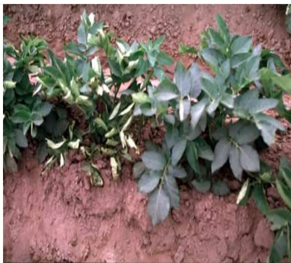
شکل ۵- بوته‌های سیب‌زمینی مبتلا به ویروس برگ قاشقی (PLRV)