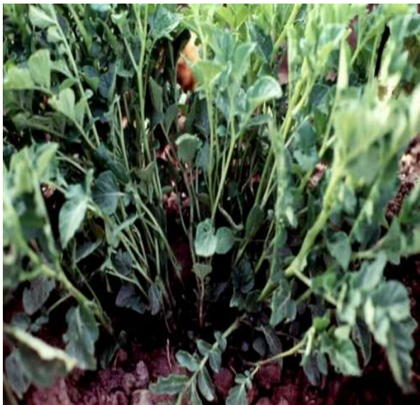
شکل ۲- انبوه شدن بوته‌های سیب‌زمینی (جاروک)