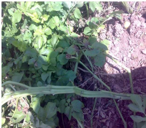
شکل ۳- بوته سیب‌زمینی با رشد کتابی ساقه