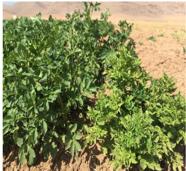
شکل ۱- ارغوانی شدن، ریزبرگی و پژمردگی بوته سیب‌زمینی