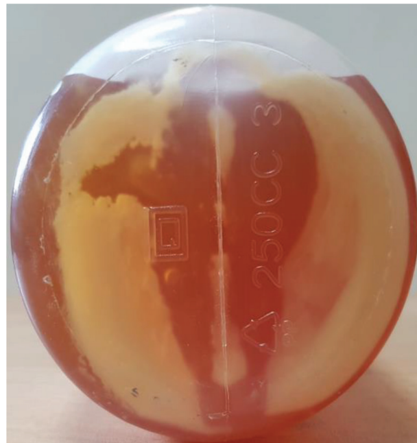
تصویر شماره ۴- رسوب اجرام در کف بطری واکسن.