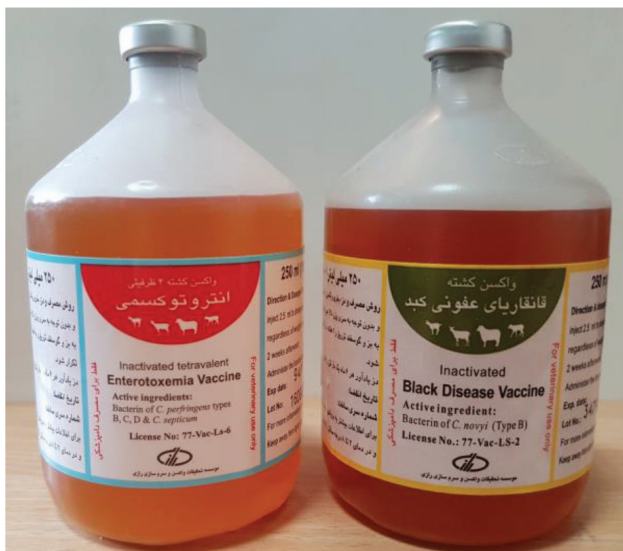
تصویر شماره ۱- تفاوت رنگ واکسن‌های مختلف.

۷- در مورد واکسن‌هایی که بصورت لیوفیلیزه هستند، قرص