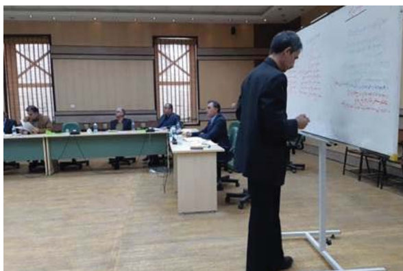
ادامه شکل ۲- برگزاری کارگاه‌های آسیب‌شناسی قوانین و مقررات بهره‌برداری از مراتع

در خلال کارگاه بیش از یکصد ایده جمع آوری شد. بعد از آن ایده‌ها طبقه‌بندی شده و به‌منظور نظرسنجی و امتیازدهی در مورد قابلیت پاسخ به پرسش مشترک و اجرایی بودن هر یک از اقدامات، در قالب یک فرم ارزیابی به شرکت‌کنندگان کارگاه ارسال شد. سپس، مناسب‌ترین و واقع‌بینانه‌ترین اقدامات استخراج شده از فرم‌های ارزیابی، مورد بحث با کارشناسان قرار گرفت و با در نظر گرفتن تجربیات و تخصص‌های مختلف، در قالب بسته‌های اقدامات برنامه راهبردی تدوین شد. در نهایت، پیش‌نویس برنامه راهبردی در کارگاه دوم در شهر اصفهان در اختیار شرکت‌کنندگان کارگاه، قرار گرفت و به‌منظور دریافت نظرات و بازخورد آنها و همچنین اخذ تأیید نهایی، نتایج برای آنان ارائه شد. بر اساس کارگاه‌های مرحله اول و دوم و همچنین نظرات اخذ شده از خبرگان بخش مرتع کشور، عوامل درونی (نقاط قوت و ضعف) و عوامل بیرونی (نقاط فرصت و تهدید) تبیین شد.