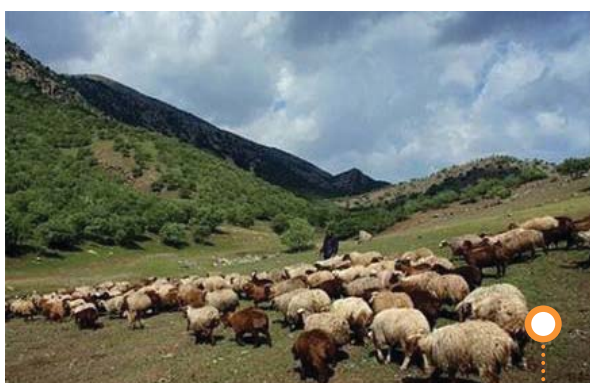
شکل ۱- دام مازاد بر ظرفیت مراتع اصفهان

غالب بهره‌برداری از مراتع است؛ بنابراین دامداران، نقش آفرینان اصلی هستند که شرایط محیط‌زیستی و توسعه منطقه را مشخص می‌نمایند. درک مفاهیم قوانین و مقررات که بتواند اثرات منفی تخریب محیط زیست را خنثی نموده و باعث استفاده بهینه از مراتع محدود در راستای اهداف اقتصادی - اجتماعی شود، فقط از طریق درک عمیق و ادغام راهبردی بهره‌برداران با کارشناسان امکان پذیر است. بنابراین لازم است که آسیب‌پذیری قوانین و مقررات مراتع در برابر فشار بهره‌برداران بر روی آن، که به‌طور تنگاتنگی با آینده محیط زیست در هم آمیخته است، ارزیابی شود. در این ارزیابی، شناسایی عوامل کلیدی آسیب‌پذیری از اهمیت زیادی برخوردار است. چراکه می‌توانند به عنوان گزینه‌های ورودی جهت فعالیت‌های مبسوط‌تر مورد استفاده قرار گیرند.