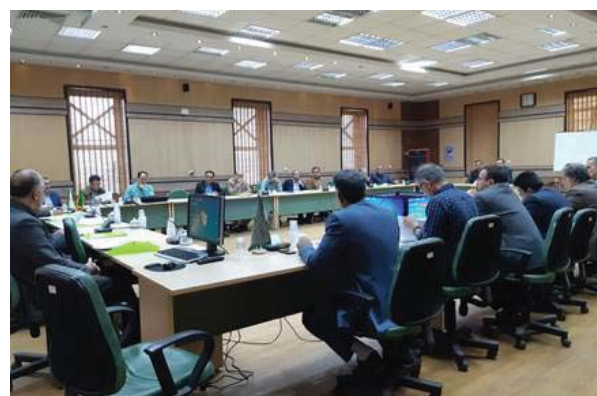
شکل ۲- برگزاری کارگاه‌های آسیب‌شناسی قوانین و مقررات بهره‌برداری از مراتع