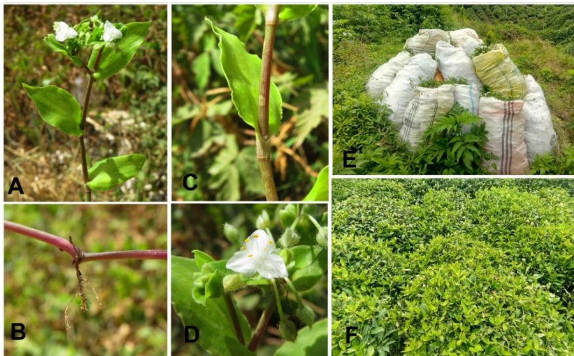
شکل ۱- Tradescantia fluminensis : A. نمایی کلی از گیاه، B. ریشه نابجا از محل گره، C. برگ و غلاف دور ساقه، D. گل و گل آذین، E. توده جمع‌آوری شده از گیاه در باغ چای، F. پوشش بوته‌های چای با گیاه مهاجم.

Fig. 1. Tradescantia fluminensis : A. Habit, B. Adventitious root in nod, C. Leaves and sheets on the stem, D. Flower and inflorescent, E. Mass collected from the invasive plant in the tea garden, F. Tea plants covered with the invasive plant.