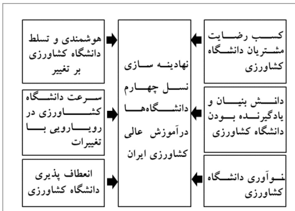
نگاره ۱- مدل مفهومی تحقیق

نگاره شماره ۲، نیز مؤلفه‌های شناسایی شده نهادینه سازی نسل چهارم دانشگاه‌ها در آموزش عالی کشاورزی ایران را با استفاده از نرم افزار MAXQDA، نشان می‌دهد. لازم به ذکر است که نرم افزار MAXQDA برای کدگذاری و تحلیل داده‌های کیفی استفاده می‌شود. قابلیت این نرم افزار در سازگاری با زبان فارسی و مدل سازی بهتر از دیگر نرم افزارهای تحلیل داده‌های کیفی مانند Nvivo، می‌باشد. در نرم افزار MAXQDA، می‌توان بخش‌های مختلف اسناد گوناگون به صورت متن، جدول، عکس، صوت و تصویر با فرمت‌های مختلف را به صورت کیفی کدگذاری نموده و علاوه بر این می‌توان با استفاده از ابزار کدگذاری خودکار، اسناد متنی را نیز کدگذاری کرد.