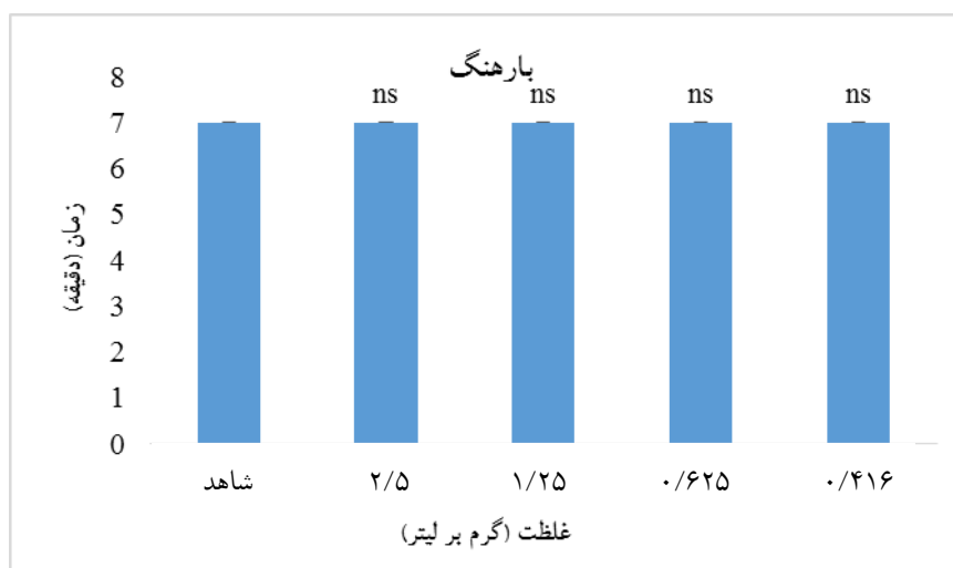
شکل ۳- اثر غلظت‌های مختلف عصاره اتانولی دانه بارهنگ کبیر بر شاخص انعقادی CT

لیتر، در میان دیگر غلظت‌های در نظر گرفته شده به طور معنی‌داری زمان ترومبوپلاستین نسبی (APTT) را نسبت به گروه شاهد کاهش داده است. این اثر برای غلظت ۱/۲۵ در مقایسه با ۰/۶۲۵ به صورت پلکانی (کاهش - افزایش) است که به نظر می‌رسد با انجام بهینه‌سازی بیشتر برای غلظت‌های بکار برده شده می‌توان چنین استنباط کرد که در غلظت‌های