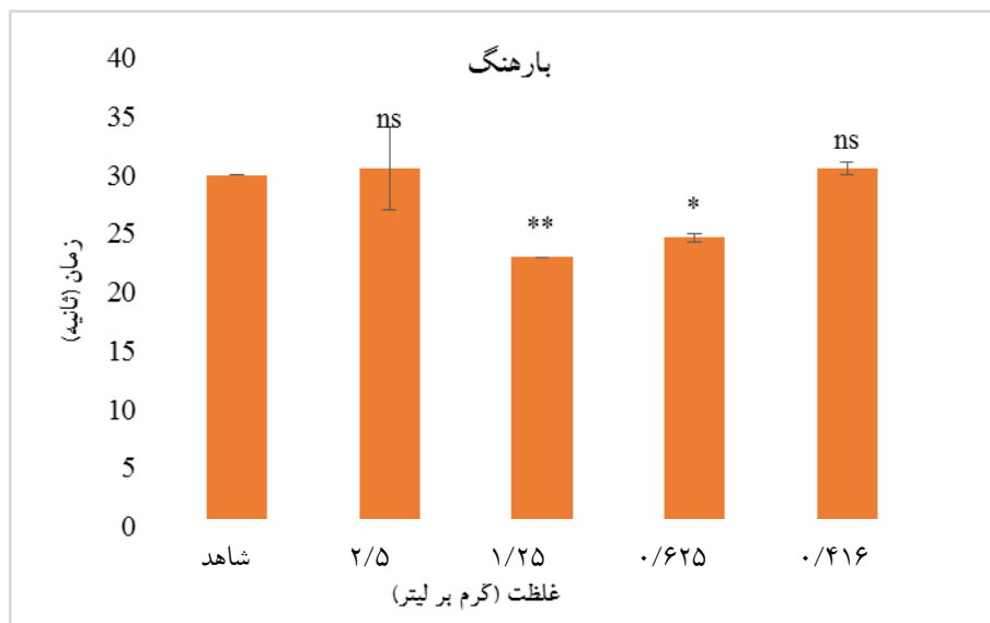
شکل ۲- اثر غلظت‌های مختلف عصاره اتانولی دانه بارهنگ کبیر بر شاخص انعقادی APTT

نداشته، از این رو طی تجزیه و تحلیل‌های آماری انجام شده معنی‌داری قابل توجهی برای آنها تشخیص داده نشده است. عصاره دانه بارهنگ در غلظت‌های ۱/۲۵ و ۰/۶۲۵ گرم بر