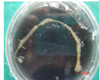
شکل ۱- تمایل به تشکیل کالوس در بعضی از ریزنمونه‌های تلقیح شده با سویه ۱۷۲۴

از میان ۷ نوع ریزنمونه مورد آزمایش، جنین‌های ۱۴- ۱۰ روزه، بهترین و تنها گزینه‌هایی بودند که منجر به تولید ریشه موپین گردیدند. در مورد ریزنمونه‌های محور زیرلپه‌ای، لپه‌ها، برگ اصلی و ریشه، پس از تلقیح با آگروباکتریوم، یا هیچ تغییری حاصل نشد و یا بعد از چند روز زرد شده و از بین رفتند. همچنین در بعضی موارد حالت کالوسی به خود گرفتند (شکل ۱). استفاده از هیچ‌کدام از انواع کالوس‌ها نیز منجر به تولید ریشه موپین نشد.