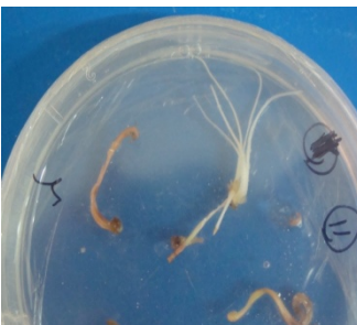
شکل ۲- ظهور ریشه‌های موپین F. gummosa حدود ۱۴ روز پس از تلقیح با آگروباکتریوم رایزوتنز