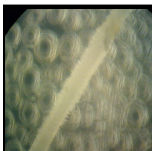
شکل ۳- نمای کرکین ریشه‌های موپین ترا ریخت F. gummosa در زیر بینوکولار