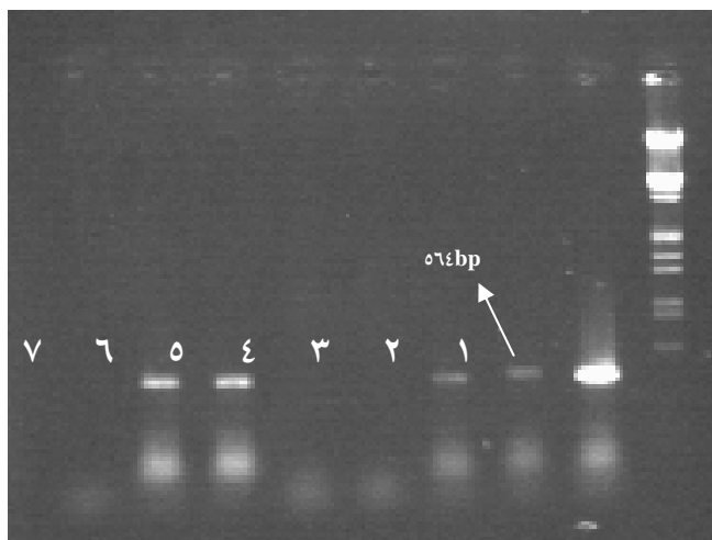
شکل ۵- انجام PCR با پرایمرهای اختصاصی ژن rol B : باند تکثیر شده از پلاسמיד سویه ۱۵۸۳۴ (۱)، باند تکثیر شده از کلن ریشه مویین شماره ۱ (۲ و ۳)، عدم تکثیر باند از DNA ریشه‌های طبیعی (۴ و ۵)، باند تکثیر شده از کلن ریشه مویین شماره ۲ (۶ و ۷)، کنترل منفی (۸)، با استفاده از سایز ماکر Lambda DNA / EcoRI + HindIII

زخمی شدند، چون بافت جوان‌تری داشته، همچنین مواد مؤثره کمتری در آنها تولید شده و به بیماری مبتلا نشدند، بعد از تلقیح مدت زمان بیشتری می‌توانند زنده بمانند تا ژن‌های منتقل شده توسط آگروباکتریوم بتوانند بهتر بیان شوند. در واقع می‌توان اینطور نتیجه‌گیری کرد که هیپوکوتیل مکان مناسبی برای ایجاد القای ژنتیکی در این گیاه می‌باشد اما چون ریزنمونه‌های این گیاه بسیار ظریف و حساسند و زود دچار بیماری شده و از بین می‌روند، قطع نکردن کوتلیدون‌ها و ریشه‌چه می‌تواند به زنده ماندن بیشتر ریزنمونه و محافظت در برابر اثرات سوء واکشت‌های متعدد، هم‌کشتی با آگروباکتریوم و اثر آنتی‌بیوتیک کمک کند. در ضمن Park و همکاران (2000) با استفاده از ریزنمونه‌های حاصل از جوانه‌های پنج روزه و جنین سوماتیکی، Le و همکاران (2004) نیز با استفاده از ریزنمونه هیپوکوتیل، موفق به القای ریشه مویین در گیاه Papaver somniferum شدند، که با نتایج این تحقیق همخوانی دارد. به منظور القای ریشه مویین در گیاه Anethum graveolens از خانواده چتریان، Santos و همکاران (2002) از گیاهچه‌های جوانه زده ۳ تا ۴ هفته‌ای استفاده کرده و به کمک سوزن استریل هیپوکوتیل و قسمت‌های گره‌ای را زخمی کرده و سپس آنها را در