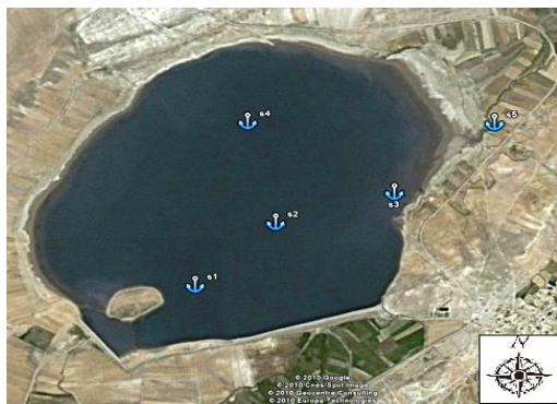
شکل ۱: ایستگاه‌های دریاچه سد مخزنی اردلان

این پژوهش ارزیابی خصوصیات زیستی و غیر زیستی دریاچه و اقلیم منطقه به‌منظور امکان دستیابی به تولیدی مطلوب‌تر بود.