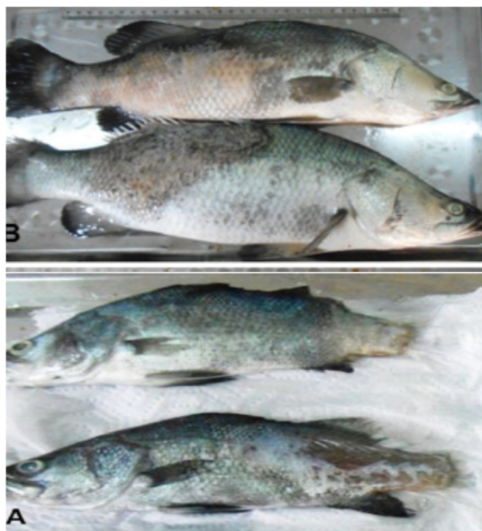
شکل ۲. علائم بالینی (ظاهری) ماهی باس دریایی آسیایی بیماری در اثر ویبریو هاروی (A, B) (Novriadi, 2016)

عوارض بالینی بیماری ویبریوزیس شامل ظهور نقاط قرمز رنگ روی پوست، نواحی جانبی و شکمی ماهی، تورم شکم و در بیشتر موارد زخم‌های پوستی تیره می‌باشد که در آن ناحیه و اطراف آن ریزش فلس نیز دیده می‌شود (شکل ۲). با گسترش زخم‌های قرنی‌ای تیره رنگ در ماهی محتویات چشم از بین می‌رود. در فرم حاد فرآیند ابتلا به بیماری سریع است و ماهی عوض بالینی خاصی را نشان نمی‌دهد. همچنین زخم‌ها در پوست نیز قابل مشاهده هستند. ابتدا باکتری در طحال یافت می‌شود ولی همچنان که تعداد سلول‌ها در این اندام افزایش می‌یابد، باکتری در کلیه و کبد نیز مستقر می‌شود. همچنین به «کبد کم رنگ» ۳۷ و «کبدچرب» ۳۸ به عنوان علائم ویبریوزیس ناشی از ویبریو هاروی اشاره شده است (Gibson-Kueh et al., 2012).