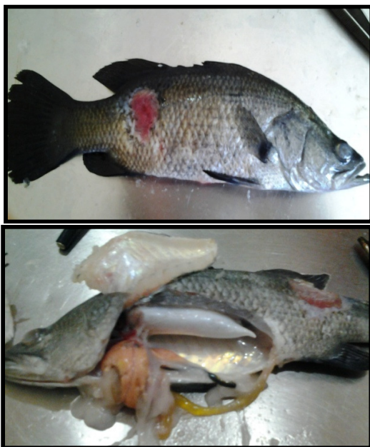
شکل ۳. ماهی باس دریایی آسیایی پرورش در قفس (بندر چارک - روستای گرزه) با علائم ویبریوزیس شدید ناشی از ویبریوزیس (عکس از نگارنده).

بررسی بیماری ویبریوزیس در ماهی باس دریایی آسیایی از مزارع پرورش در قفس و استخرهای فعال در استان‌های جنوبی کشور در طی یک سال توسط نگارنده نشان دهنده درصد شیوع بالای آن در مزارع در فصل بهار و تابستان بوده است. غالب جدایه‌های باکتریایی جداسازی شده از ماهیان با علائم ویبریوزیس از طریق شناسایی بیوشیمیایی و مولکولی «واکنش زنجیره‌ای پلی‌راز» ۹ باکتری ویبریوزیس تشخیص داده شد. همچنین بیشترین علائم بالینی ماهی عفونی شده با ویبریوزیس که در نمونه‌ها مشاهده گردید به شرح شکل (۳) می‌باشد.