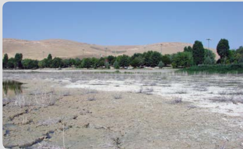
شکل ۶- سراب نیلوفر، تابستان ۱۳۹۴

خاک و کاهش ظرفیت نگهداری رطوبت خاک شده است. لذا تغییر الگوی کشت در حوزه‌های آبخیز استان و لغو مجوزهای حفر چاه‌های عمیق، مسدود کردن چاه‌های غیرمجاز، توقیف تجهیزات غیرقانونی برداشت از آب‌های زیرزمینی و برخورد با متخلفان از برنامه‌های پیشنهادی برای احیای سراب‌ها و تالاب‌های خشکیده است زیرا نابودی رویشگاه‌ها و به‌دنبال آن اکوسیستم‌های خاص و گونه‌های گیاهی حاضر در آنها موجب خسارات محیط‌زیستی غیرقابل جبرانی خواهد شد.