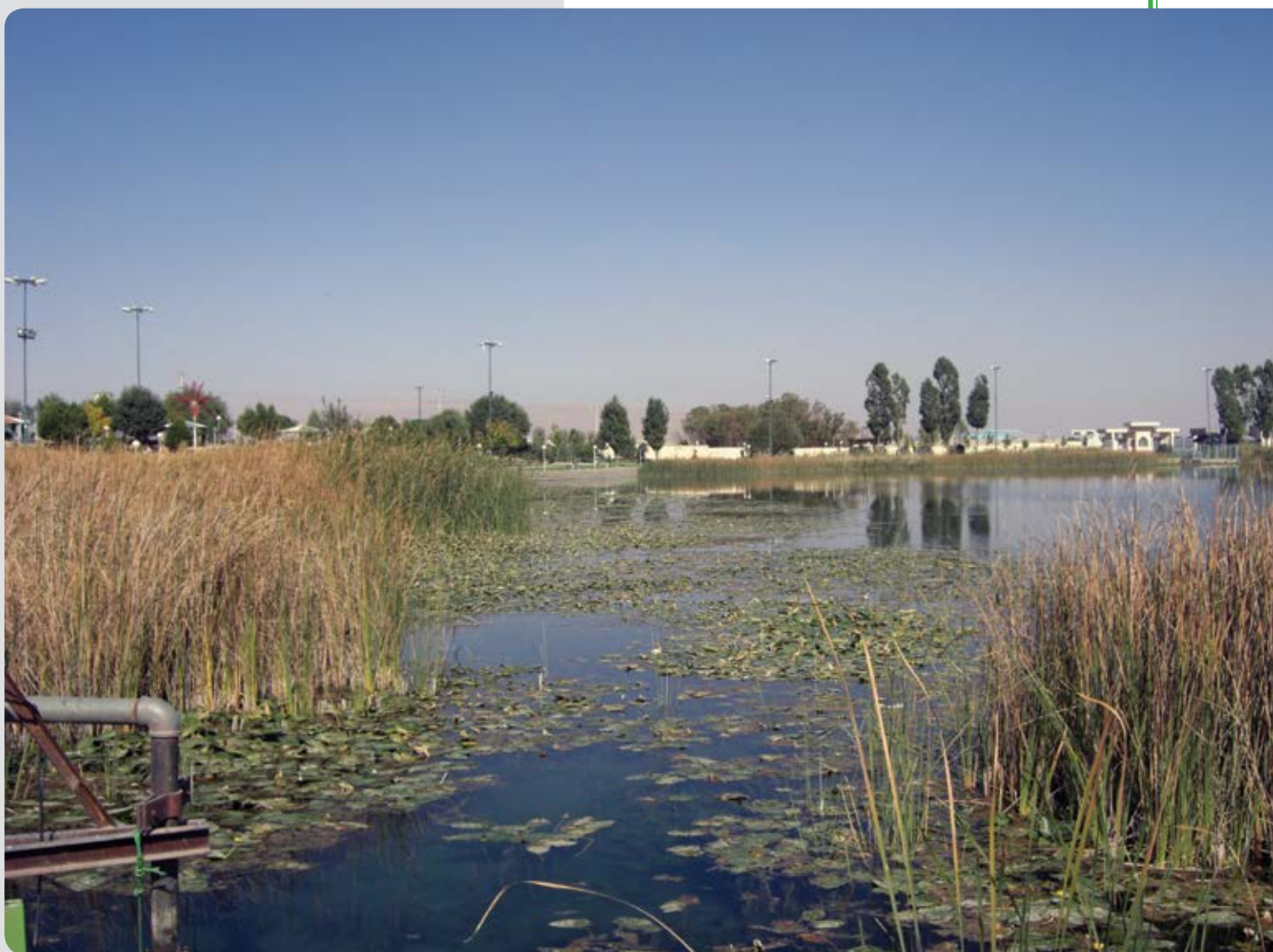
شکل ۵- سراب نیلوفر، تابستان ۱۳۹۳، عکس از یحیی خداکرمی

انسانی و محیطی همانند میزان برداشت آب و نیز کاهش بارندگی، در خشکسالی سراب نیلوفر مؤثر بوده و گل‌های نیلوفر زرد به دلیل خشکسالی‌های اخیر در سراب دچار آسیب جدی شده‌اند. گزارش‌های ارسالی و بازدیدهای مکرر زیستگاه آنها، از بین رفتن گل‌های نیلوفر زرد را حکایت می‌کنند به طوری که حتی یک پایه از آنها مشاهده نشد. آن‌طور که سرپرست محوطه سراب می‌گوید: «آب به سراب برگشته اما نیلوفری در کار نیست. ریشه سطحی نیلوفرهای آبی در خشکسالی‌ها خشکید و تمام شد.» به عبارت دیگر از سال ۱۳۹۴ که سراب خشکید و بعد دوباره زنده شد، دیگر نیلوفری در آن نروید (شکل ۷). عامل اصلی این خشکیدگی در کنار عوامل جوی و خشکسالی‌ها، برداشت‌های بیش از اندازه از منابع آب زیرزمینی و فقدان مدیریت صحیح منابع آبی استان بوده است. بهره‌برداری بیش از اندازه از حوضه‌های آبریز استان کرمانشاه که عمدتاً صرف آبیاری باغ‌ها و مزارع به صورت گسترده می‌شود باعث فرونشست