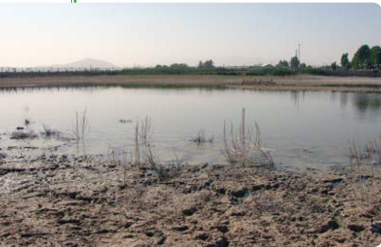
شکل ۷- سراب نیلوفر، تابستان ۱۳۹۶

بی‌نام، ۱۳۸۵. مطالعه منابع آبی استان کرمانشاه و توسعه آبی‌روزی. سازمان جهاد کشاورزی استان کرمانشاه، مدیریت شیلات. ۶۵۰ صفحه.