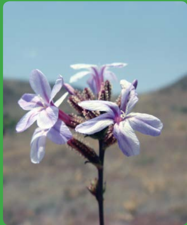
شکل ۳- Plumbago europaea L.