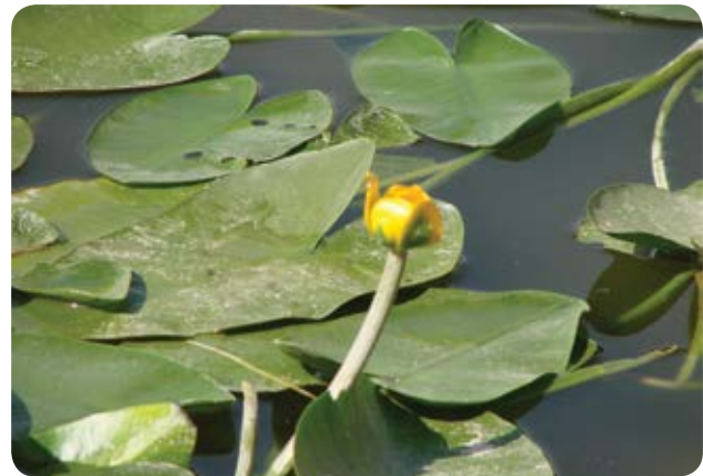
شکل ۱- Nuphar lutea (L.) Sm.

و معماری ایران باستان دارد که یکی از نمونه‌های بارز آن را در نقوش طاق‌بستان کرمانشاه می‌توان دید. به باور برخی مورخان، نیلوفرهای آبی که در نقش برجسته‌های طاق‌بستان دیده می‌شود با الهام از نیلوفرهای سراب نیلوفر در دل کوه نقش بسته‌اند. آب سراب نیلوفر آن‌چنان زلال است که ساقه گل‌های نیلوفر از زیر آن به‌وضوح نمایان است. به‌دلیل نزدیک بودن به شهرستان کرمانشاه و نیز احداث پارک در محیط اطراف دریاچه، یکی از تفرجگاه‌های زیبای استان کرمانشاه محسوب می‌شود و مورد استقبال بازدیدکنندگان بسیاری، به‌خصوص در ماه‌های گرم سال قرار می‌گیرد. عمق بعضی قسمت‌های این سراب به بیش از ۳۲ متر می‌رسد. همچنین این سراب دارای غارهای زیرزمینی و چند