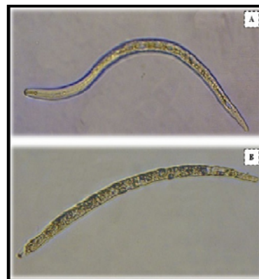
شکل ۱- A: لارو سالم Pratylenchus loosi ، B: لارو نماتود تحت تأثیر قارچ Paecilomyces lilacinus (T1) پس از ۱۶۸ ساعت (یک هفته) در محیط آب آگار ۱/۵ درصد.

Fig. 2. A: Healthy female Pratylenchus loosi , B: female nematode under the influence of the fungus Paecilomyces lilacinus (T1) after 168 hours (a week) on water agar 1.5%, C: healthy male nematode, D: male nematode under the influence of the fungus Paecilomyces lilacinus (T1) after 168 hours (a week) on 1.5% water agar.