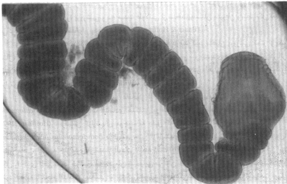
شکل ۲: انگل بوتریوسفالوس جدا شده از روده ماهی فیلیپی