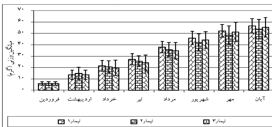
نمودار ۲: تغییرات میانگین وزنی در سال دوم پرورش در آب شیرین

آن برابر 0/2 و حداکثر آن 0/3 بود. برطبق نتایج آنالیز واریانس، اثر تراکم ماهی در هکتار روی میزان متوسط رشد روزانه ماهی